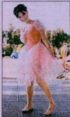
因九二一地震受傷截肢的小汶，舞出希望與開懷。