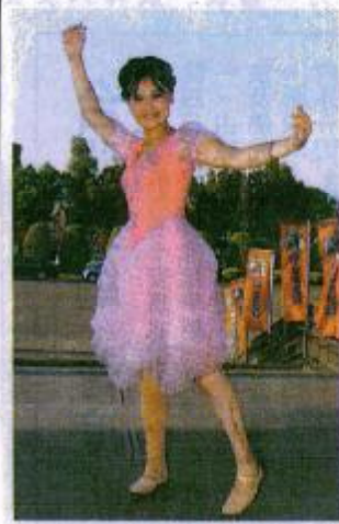
因地震受傷截肢的小汶，自信舞出希望。